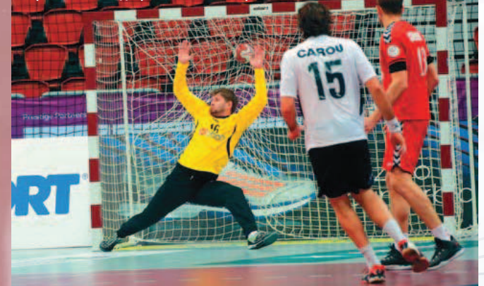
Игры Левшин под аргентинским обстрелом

отборов: по два – от Европы и Азии, по одному – от Африки и Америки. ЕВРОПА: С СОЛЬЮ И ПЕРЦЕМ Итак, мы подошли к важному заключению: интрига чемпионата Европы в Польше будет изрядно усложнена олимпийскими подтекстами! Во-первых, чемпион Европы (а возможно, даже серебряный призер) станет и участником Олимпиады. Во-вторых, в олимпийскую квалификацию попадут еще две европейские