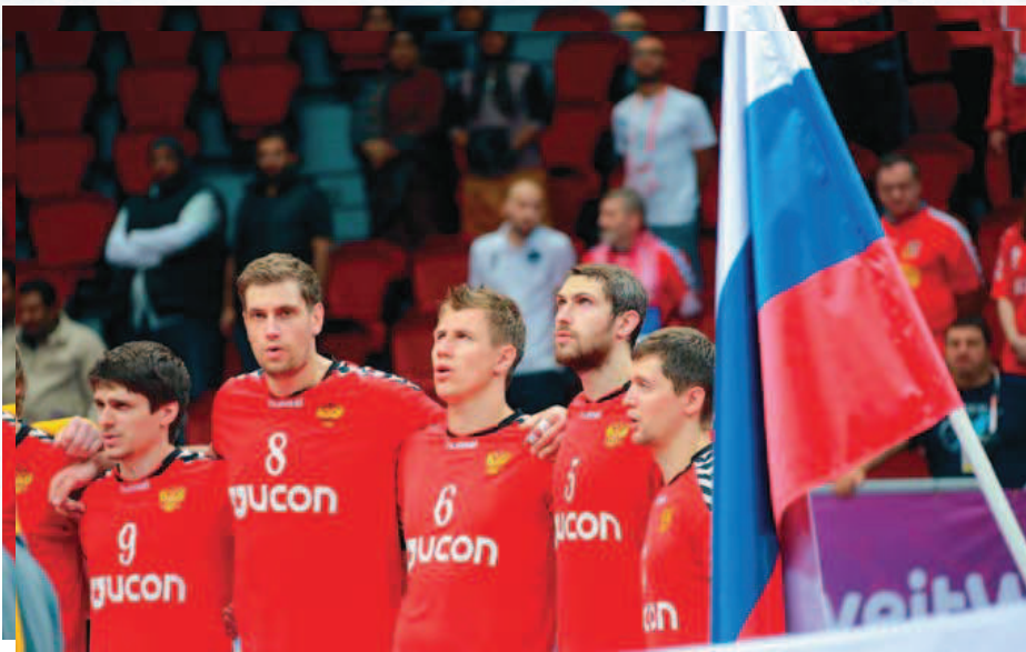
Первые в истории неевропейская сборная добралась до пьедестала